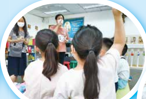
聖母月活動：齊向聖母學習