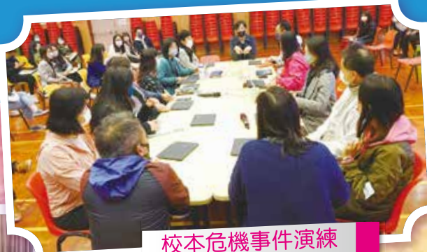
校本危機事件演練

本校重視教師團隊的專業發展，以促進學校發展及配合學生的成長需要。本年度由學校駐校教育心理學家為學校舉行了一次危機事件演練，讓學校持分者認識危機事件處理程序。此外，學校亦重視國家安全教育。本年度舉行了跨校的國家安全教育教師培訓，由教育局德育、公民及國民教育組主持。