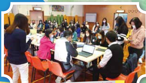
危機事件處理程序練習