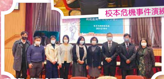
國家安全教育工作坊