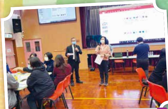
學校代表分享校本國安教育課程