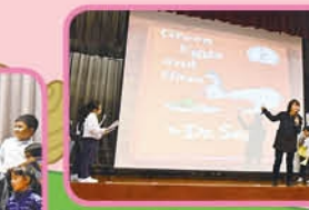
Miss Rita conducts the Readers' Theatre with 3E students.