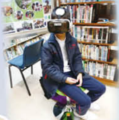
同學在屯門天主教中學體驗虛擬實景的旅程