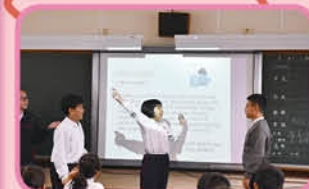
6E students show how to play card games which were designed by themselves.