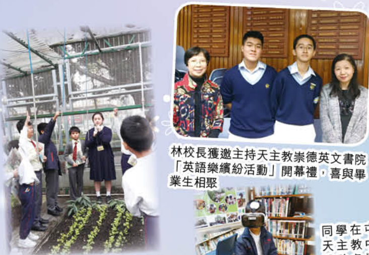
林校長獲邀主持天主教崇德英文書院「英語樂繽紛活動」開幕禮，喜與畢業生相聚