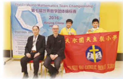
我校奧數隊精英於北京舉行的第七屆數學團體錦標賽中獲兒童組銀獎及銅獎