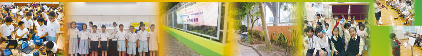
機械人大決戰 STEM in mBot 2016 工作坊 本校辯論隊參加「耀道盃」小學校際辯論賽 學校內外牆重塗油漆，令校園煥然一新 齊來享受摺紙樂趣 樂器演奏

一年一度的學校旅行於 9 月 30 日順利完成。當天天氣晴朗，全校師生及參加一年級親子旅行之家長盡情享受大自然景色，大家度過了既愉快又難忘的一天。是次旅行地點如下：