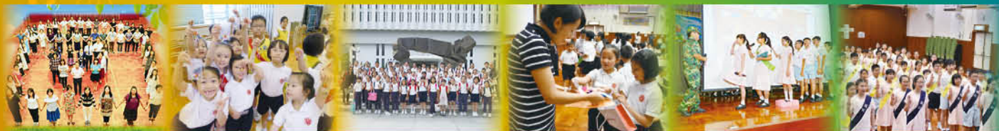
全體教職員合照 基督小先鋒—小一串唸珠活動 參觀「窯火天工：香港中文大學文物館藏歷代陶瓷展」 敬師日活動 畢業典禮英文話劇 風紀宣誓就職