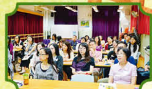
10月26日上午全體老師參與「守護天使」教師培訓計劃