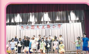
5B students are cool singers.