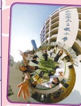
同學在多元智能課「電腦 Super Fun」中，體驗虛擬實境技術並學習運用 360 度相機進行拍攝