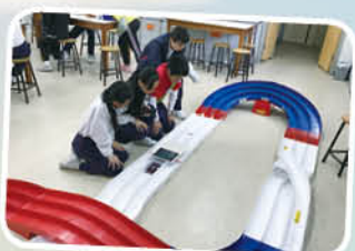
同學在天主教培聖中學學習計算四驅車的速率