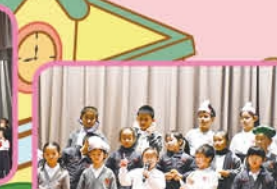
2E students play the roles of people doing different jobs.