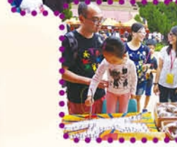
老師們全家出席明愛賣物會，齊來玩慈善攤位遊戲，一家大小做善事，為善不甘後人