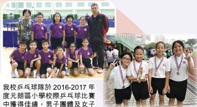
我校乒乓球隊於 2016-2017 年度元朗區小學校際乒乓球比賽中獲得佳績，男子團體及女子團體均獲得季軍