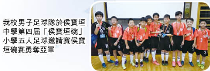
我校男子足球隊於侯寶垣中學第四屆「侯寶垣碗」小學五人足球邀請賽侯寶垣碗賽勇奪亞軍