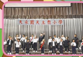
1B students perform choral speaking - Five Little Monkeys.