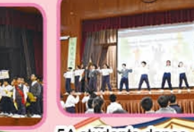
5A students dance energetically.