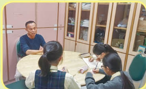
小記者們訪問「郭教授」的片段