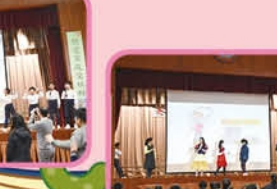
5E students act out a new ending of Cinderella.