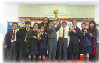
我校辯論隊同學於第四屆《耀道盃》小學校際辯論邀請賽勇奪五個大獎