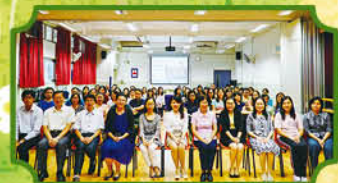
10月26日下午全體老師與屯門天主教中學校長及老師交流校本學與教的發展

本校於 2016 年 10 月 26 日舉行教師發展日，以促進教師全方位認知學生身心靈的學習需要。是日全體老師於屯門天主教中學進行專業培訓及交流。上午全體老師參與「守護天使」教師培訓計劃，學習學童情緒高危知識；下午進行跨校學與教交流活動，全體老師與屯門天主教中學校長及老師交流校本學與教的發展。