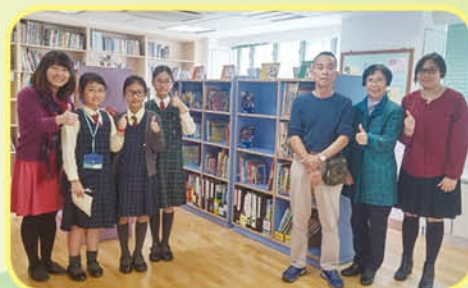
「郭教授」和林校長、老師、小記者們在他的得意之作——圖書櫃前留影

「郭教授」沒有學習木工或相關課程，每次為我們製作新設施時，他會先參考、觀察同類型用具的設計，不斷地思考、研究，然後付諸行動，嘗試創作。郭先生做事力臻完善，設施做工精細，可謂毫無瑕疵，商店裏賣的桌子、椅子等也不及「郭教授」親手量製的精美、穩固、妥貼呢！他的設計不單具創意，更常運用環保物料循環再造，希望為學校節省開支，讓學校的資源能運用於學生學習上，這種以愛對待學校、孩子的精神，真的令我們相當敬佩！