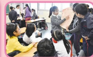
6A students introduce a festival to P4 students.

The enthusiasm, creativity and talents of all English students and teachers made this Fun Day a huge success.