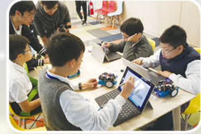
同學們在元朗天主教中學為 Mbot 機械人進行編程