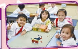
一年級學生透過拼砌 LEGO，訓練空間感和提高拼砌能力