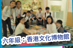
六年級：香港文化博物館