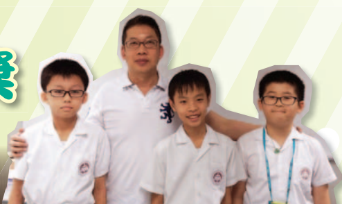
入圍同學一同前往香港城市大學訪問江潤樟博士，了解科學家的生活及工作。

「香港科學青苗獎」是由教育局資優教育組主辦，比賽目的是為培育初中及高小資優學生在科學方面的才能，並提供科學解難技巧、協作、批判性思維、創意與溝通能力等方面的訓練，鼓勵學生進行相關文獻的整理和研究，發揮他們的創意，為一個「未來世界 / 現實難題」提供不同的解決方案，以培養學生高解決難題能力和良好的道德修養。本校學生由初賽、準決賽，及後再晉身決賽，並獲得優異獎成績，可見同學對科研有一定的興趣及天賦才能。