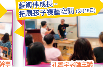
藝術伴成長 - 拓展孩子視藝空間 (5月19日)