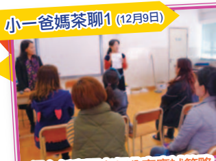
小一爸媽茶聊1 (12月9日)

家長持續參與「午間小聚」時段的各項活動，學習精神可嘉。在「個人無限讀」方面的表現更值得讚賞，堪作子女的好榜樣。