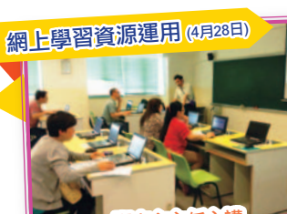
網上學習資源運用 (4月28日)