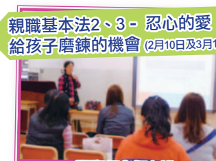
親職基本法2、3 - 忍心的愛，給孩子磨鍊的機會 (2月10日及3月10日)