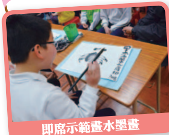
即席示範畫水墨畫