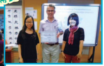
教育局外籍英語老師組小組成員到校主持閱讀工作坊