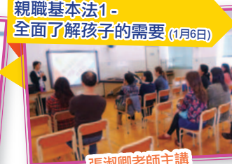
親職基本法1 - 全面了解孩子的需要 (1月6日)