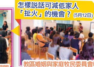
怎樣說話可減低家人「扯火」的機會? (5月12日)