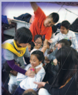
陽光小領袖「宇宙最強」領袖日營