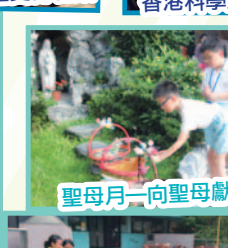
聖母月一向聖母獻神花