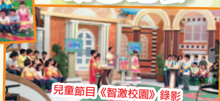
兒童節目《智識校園》錄影