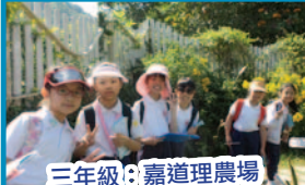
三年級：嘉道理農場