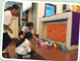
大家把自己的「家」奉獻給天主，立志一起侍奉上主。