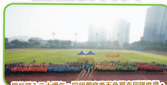
學校踏入二十週年，同學們穿着五色襯衣列隊進場。

1月26日早上，在冬日的陽光照耀下，天水圍天主教小學假天水圍運動場舉行了第九屆陸運會。為了慶祝學校踏入二十周年，師生們穿著自己設計的襯衣，參與了簡單而隆重的進場儀式。各班整齊列隊，代表所屬班別顏色的襯衣交織成一幅絢麗的畫面，象徵了大家團結合作的體育精神。