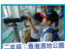
二年級：香港濕地公園