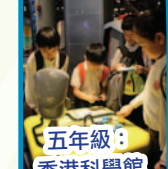
五年級：香港科學館