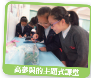
高參與的主題式課堂