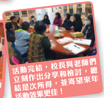
活動完結，校長與老師們立刻作出分享和檢討，總結是次所得，並寄望來年活動效果更佳！