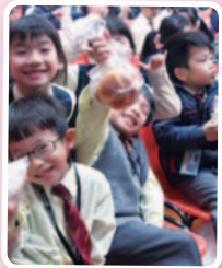
能夠幫助有需要的人，大家都充滿喜樂與平安，臉上掛著燦爛的笑容。

為紀念耶穌為我們所受的十字苦難，並效法基督捨己為人的精神，本校於3月11日舉行了「愛心午餐」活動，讓學生及教職員一同品嚐簡樸午餐，並將省下的金錢捐助有需要的人，同學透過活動能了解自己擁有的十分富足。