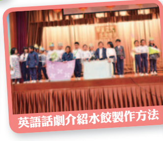
英語話劇介紹水餃製作方法