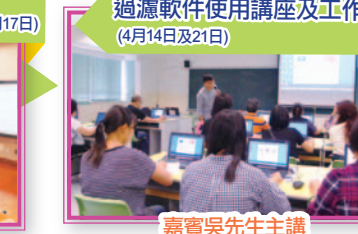
過濾軟件使用講座及工作坊 (4月14日及21日)