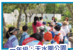
一年級：天水圍公園