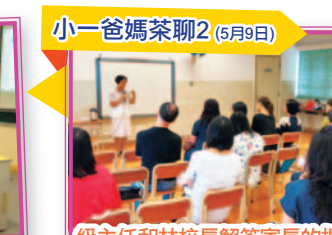
小一爸媽茶聊2 (5月9日)