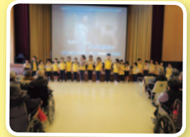
小先鋒與長者大合唱《月亮代表我的心》。