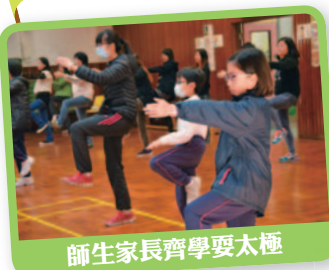
師生家長齊學耍太極