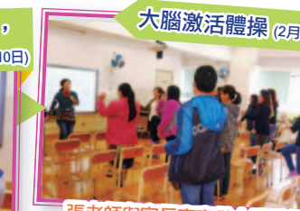
大腦激活體操 (2月3日)