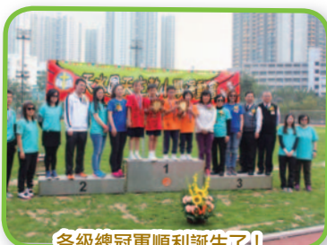
各級總冠軍順利誕生了！