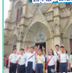
「同根同心」— 香港初中及高小學生內地交流計劃