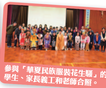
參與「華夏民族服裝花生騷」的學生、家長義工和老師合照。