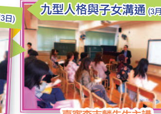
九型人格與子女溝通 (3月17日)