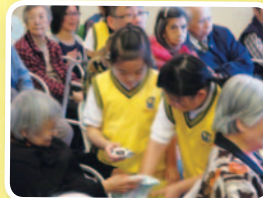
送暖行動及與長者談談心時段。