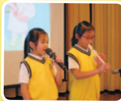
兩姊妹同為基督小先鋒，合作為長者演奏及高歌一曲。