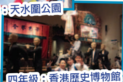
四年級：香港歷史博物館