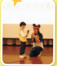
親子講故事表演《不能吃的爆谷》。

當日探訪內容有親子表演、歌詠、與長者遊戲和送暖行動，小先鋒們熱情地為長者服務，並體會「助人為快樂之本」。