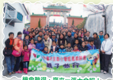
機會難得，齊來一張大合照！

本會一年一度的親子旅行，目的地為塔門，吸引了五百多名家長及學生參加。那天我們一早去到塔門，大家隨着專業的導遊作塔門環島遊覽，欣賞塔門呂字疊石的自然奇景，並飽嚙塔門漁村風味宴。飯後，大家又去到海下灣自然保護區，參觀海洋生物及古灰窯。活動期間，各人均展露出輕鬆、燦爛的笑臉，共度了一個歡快的週末。