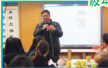
教育局數學組學校發展主任到校主持數學科課研活動