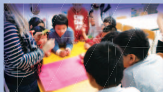
「天賦街舞」培訓課程