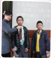
同學分享參加「愛心午餐」活動的原因——實踐基督的教訓，愛主愛人。