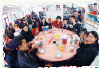
老師、家長及學生同桌吃飯，樂也融融。