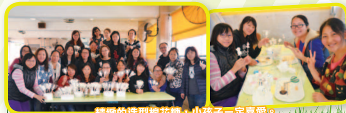
精緻的造型棉花糖，小孩子一定喜愛。