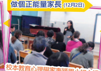
做個正能量家長 (12月2日)