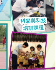
科學與科技培訓課程