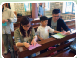
同學與父母合作，製作奉獻品，大家有商有量。

本校於11月29日舉行了公教家庭朝聖。當天，教友老師和本校的公教學生及其家長一起往粉嶺聖若瑟堂朝聖。透過是次朝聖活動，大家認清了每一位家庭成員的本份，共建和諧共融的家，一起為福傳的使命而努力。