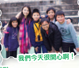
我們今天很開心啊！