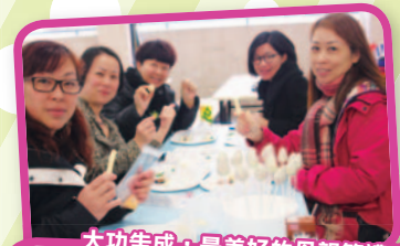
大功告成，最美好的母親節禮物