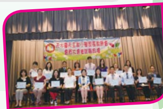
第七屆執行委員會正式履職, 齊來一張大合照。

在家教會的努力工作下, 使家長能加強與學校溝通和合作, 對學生在成長、學習上均非常重要。我們希望各位家長能繼續支持家教會, 積極參與各項活動。