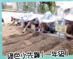
綠色小先鋒(一年級)

在「有機種植學習區」及「果樹園區」內共種有5棵「非基因改造」正版木瓜，讓學生明白要吃得健康，必須從源頭做好。