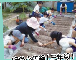
綠色小先鋒(三年級)