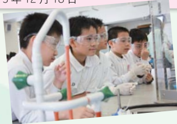
方潤華中學主辦「探索星河·體驗科學」——天文科學奇趣日。