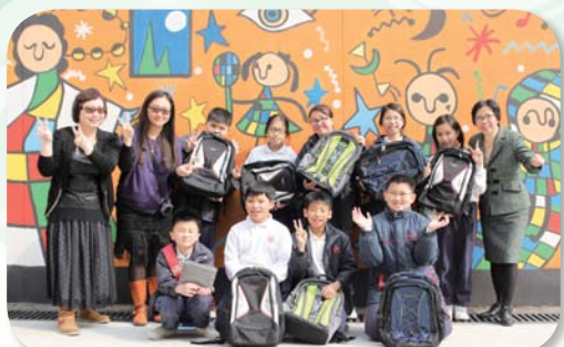
6D 班部份同學因為考試成績大躍進，所以獲林校長送贈護脊書包。看他們多開心！

這次訪問 6D 得獎的同學，不但令我們學會了不斷努力的學習態度，從他們的說話當中，還令我們學會感恩，祝願他們繼續努力，更上一層樓！