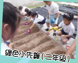
綠色小先鋒(二年級)