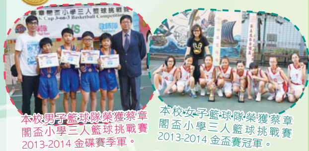
本校男子籃球隊榮獲蔡章閣盃小學三人籃球挑戰賽 2013-2014 金碟賽季軍。