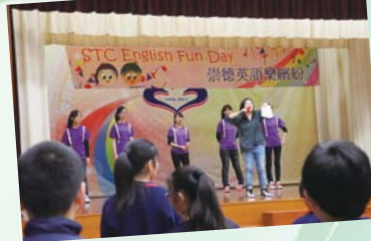
天主教崇德英文書院「英語樂繽紛活動」。