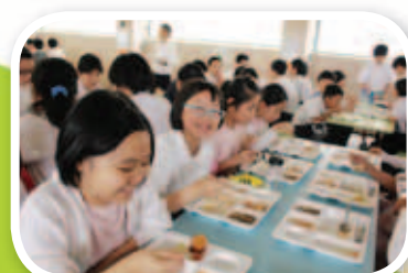
一份簡單的「素食午餐」—「綠色的蔬菜、有益的瓜類、美味的素丸、健康的米飯」，為同學們的健康「加油」！