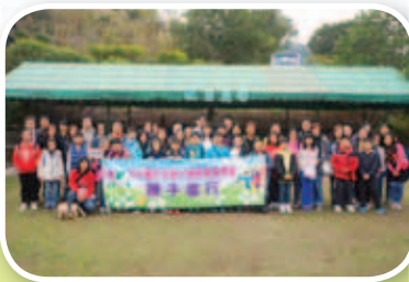
大家精神抖擻，齊來一張大合照。

本年度舉辦的親子旅行，目的地為上水假日農莊。當天，我們一行約五百人，暫且放下忙碌的工作，齊齊投入大自然的懷抱，遠離繁囂，呼吸清新空氣，在怡人的環境下進行互動遊戲，於農莊內享用燒烤午餐，共度了一個愉快的週末。