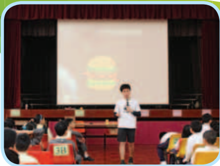
世界自然基金會為本校同學主持講座，讓同學了解能源危機，並培養節約能源的習慣。