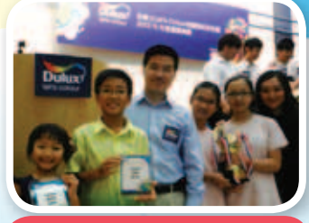
於頒獎當天，我們很榮幸能與立法會議員范國威先生合照。

「天天」參加了由多樂士主辦的 Let's Colour 校園添色彩比賽。學生、老師及家長一起美化羽毛球場的牆壁，並獲得季軍的佳績，在此感謝每一位有份在網上投票的師生及家長為我們打氣，給我們鼓勵。