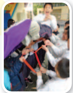
大家用繩索成功將其中一位同學拋起，感到十分雀躍。