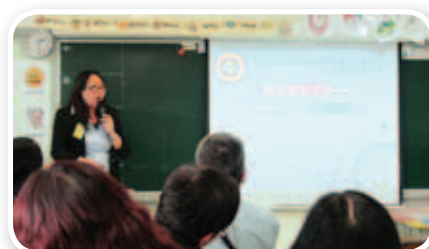
本校教師分享如何從家長教育與課程設計，推動學生養成閱讀的習慣。