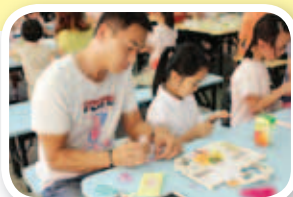
家長與學生一同製作手工藝。