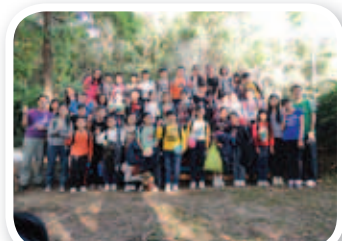
訓練圓滿結束，希望各同學繼續努力，熱心服務！