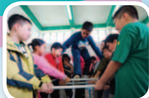
在「互相信任」活動中，一同學習如何面對及解決困難。