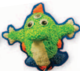
復活蛋繽紛棒 4B 范宇軒