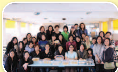
大家也能「年年有魚」，開開心心過新年了。