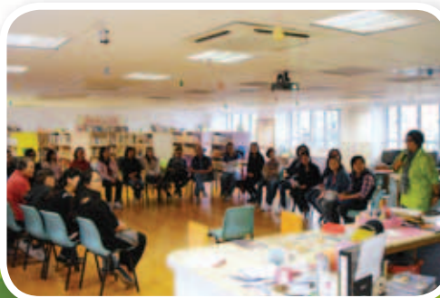
家長進行圖書共讀活動，參與的家長都非常投入，認為活動對培育孩子的品德甚有幫助。