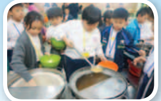
同學在宿營時，學會照顧自己，並樂意服務他人。