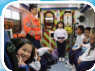
救護站內有完善的設備。