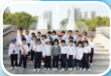
大家到天水圍中央公園認識公園裏的設施。