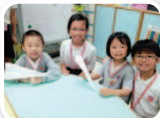
同學探訪幼稚園，帶領幼兒一起唱歌、玩遊戲、看圖書及向他們致送禮物，從服務中學習，領略照顧幼小、服務他人的意義。

「Smart Teens」服務生培訓計劃是為校內具有領導潛能的服务生，提供解難、溝通和團隊合作培訓，令他們提升個人潛能。本學年的培訓於 2013 年 2 月開始，包括培育課程、社區義工服務及宿營活動。