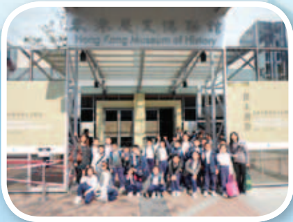
四年級同學到歷史博物館了解香港的歷史發展。