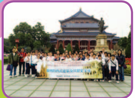
師生齊在中山紀念堂前拍照留念，並學習孫中山先生那份堅毅不屈的精神！