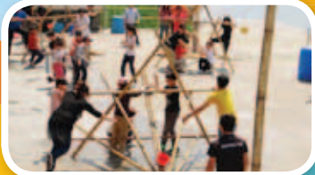
親子日營中，家長與同學以自製的大砲分組對賽，過程既緊張又刺激，一同享受了一個愉快的下午。

本年度四年級的同學踴躍參與成長的天空活動，懷著興奮的心情迎接各項挑戰，從中學習情緒管理、與人溝通、解難及團隊合作等知識和技巧。除了同學積極參與外，家長也很支持活動，超過 50 位家長出席親子日營，共享愉快的時光。