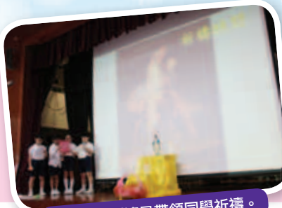
四年級的領禱員帶領同學祈禱。

在聖母月的敬禮聖母活動中，同學先祈禱，然後一邊詠唱「極溫良的母親」，一邊將花朵奉獻給聖母媽媽，藉此讓同學得到聖言的啟發，重新檢視自己，並學會親近天主，關愛別人。