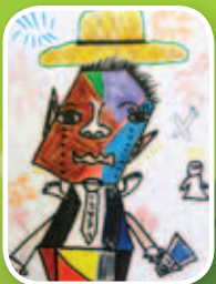
自畫像 5A 文景妍