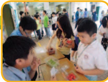
同學於小息時到雨天操場參加問答攤位遊戲，答中問題可親嚐新鮮水果，讓學生認識多吃水果的好處。