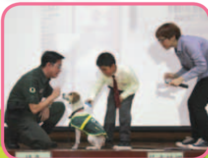
漁農署自然護理署到本校舉辦講座，藉此加深學生了解飼養寵物應有的責任，從而帶出尊重寶貴生命的正面訊息。