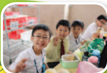
家長用心地為天天的同學準備有營的「無肉多菜」午膳。

本校於2013年4月22日參加「無綠不歡星期一校園午膳計劃」，當日全校師生積極響應，進行「素食午膳」，並獲主辦單位頒發「金獎」。