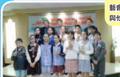
五、六年級的同學在「The Hong Kong Creative Digital Storytelling Competition 2013」的表現具自信，在各組比賽中獲得優異成績。

為提升學生的英語學習興趣及豐富他們的學習經驗，本校參加了由香港管理專業協會羅桂祥中學主辦的「The 'K S Lo Cup' Inter-school Scrabble Championship 2013」及由毅恆教育主辦的「The Hong Kong Creative Digital Storytelling Competition 2013」比賽。此外，本校亦成為香港小莎翁劇藝會之學校會員。同學除了可以參加英語戲劇課程外，並在5月時一起踏台板，在西灣河文娛中心，與他校同學作公開演出。