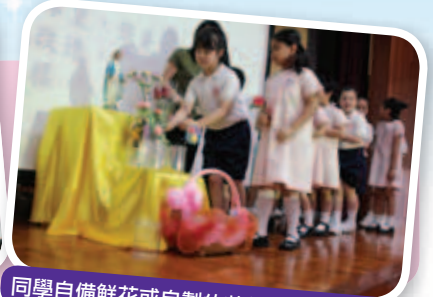
同學自備鮮花或自製的花朵，獻給聖母。