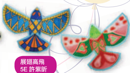
展翅高飛 5E 許紫昕