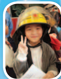
同學們能親身接觸消防員的設備，感到很新奇有趣。