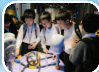
五、六年級同學對科學館的展品很感興趣。