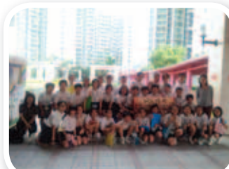
同學齊拿著載有生活必需品的禮物包，懷著一股愛心，浩浩蕩蕩地出發，探訪獨居長者。