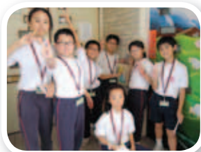
同學分組進行校園遊踪，在有限的提示下，以對賽形式挑戰自己。