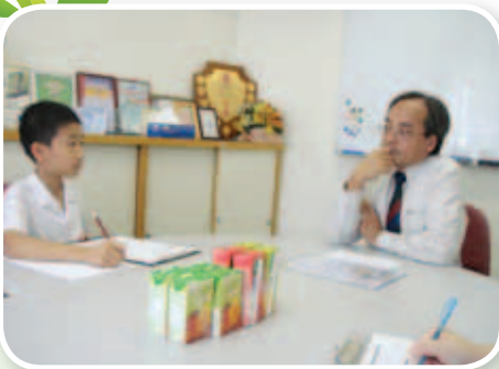
龔校長對小記者的訓勉，令他們畢生受用。