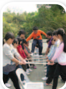
大家要互相信任，才能夠完成各項任務。