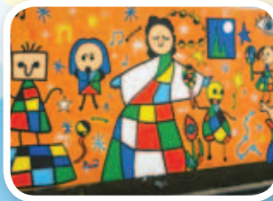
壁畫名為「童夢的色彩」，是展述孩子的童心童趣。