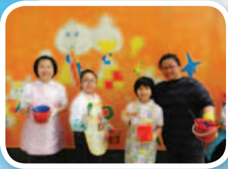
學生及家長一起為美化校園出一分力！