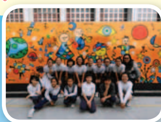
「校園化妝師」成員在辛勞的成果前來張大合照。