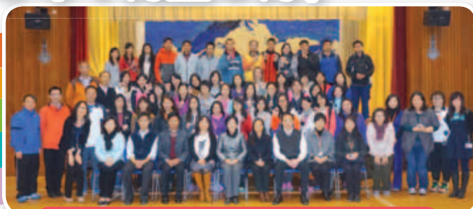
本校全體教師到訪聖文德天主教小學進行觀課及參觀交流。