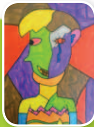
自畫像 5E 譚子健