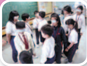
透過小組訓練，同學要克服困難，找出隊友。

參與過四年級「成長的天空」活動後，大家對團隊合作及解決難題兩方面，都有明顯的進步。本年度，再接再厲，藉着各類活動，讓同學體會團隊合作的重要。