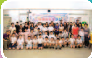
校長、老師及四年級家長一同出席啟動禮，以行動支持同學，迎接成長的天空一連串的挑战。