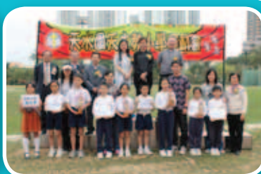
一眾嘉賓與全場總冠軍優勝班別合照。