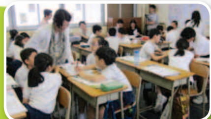
友校教師到校參觀「普教中」的示範課，交流教學心得。