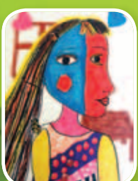
自畫像 5B 黎靖彤