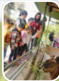
同學親手餵牛牛吃草，感到很興奮。