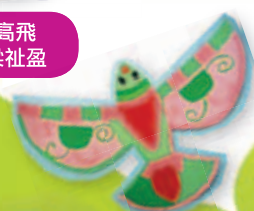
展翅高飛 5A 蕭欣瑜