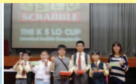
六年級同學於 Scrabble 大賽中勇奪多項獎項，感到非常興奮！