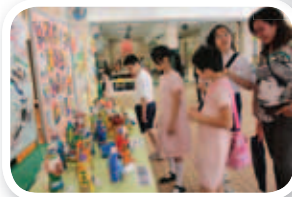
大家一起欣賞學生的學習成果。