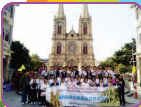
同學們來到了被列為全國重點文物保護單位的石室聖心大教堂，對那宏偉的建築物讚歎不已！

本校希望透過國內交流的體驗活動，提高學生對祖國的認識，並能確立其正確的價值觀，藉此發揚基督互助互愛的精神。