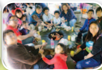
你我共聚一堂，樂也融融。