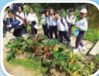
三年級同學到嘉道理農場觀察各種植物的生長情況。