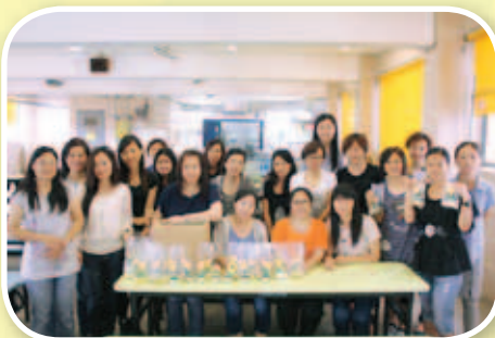
家長們製作的母親節盆栽 Cupcakes，非常精緻。