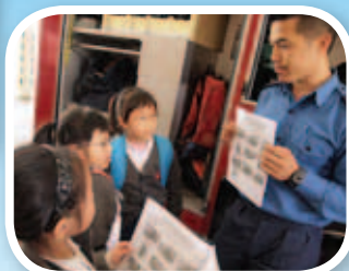
二年級同學一起參觀消防局及救護站。