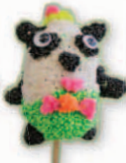
復活蛋繽紛棒 4D 林浩汶