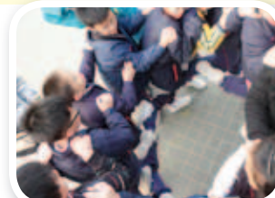
在挑戰營中，同學分組進行熱身活動，以便迎接艱難的任務。