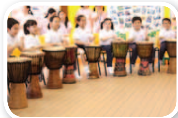
興趣班能發掘學生的才華，照亮人生。

本校致力培育學生的多元智能，家長日讓具有音樂、體育、舞蹈才華的學生盡展所長，在家長和同學的熱烈掌聲下，為家長日畫上了圓滿的句號。