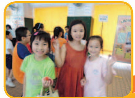
同學可穿著七色蔬果為主題之服飾，愉快地參與當天活動，與同學分享水果。