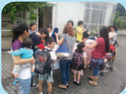
家校合作，身體力行，以行動支持環保，齊來為子女揀選合身的校服。

為了支持環保，本會每年均舉辦「發放舊校服」活動，藉此教育學生從小培養珍惜及善用舊物的態度，此活動令不少學生受惠，在此衷心感謝一班熱心的家長義工協助整理回收品，送贈有需要的家庭。