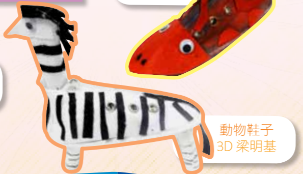
動物鞋子 3D 梁明基