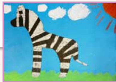
黑白動物會 3B 沈曉陽