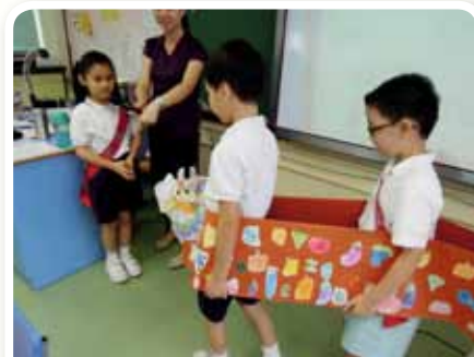
創意德育課——「七色蔬果愛國龍舟」