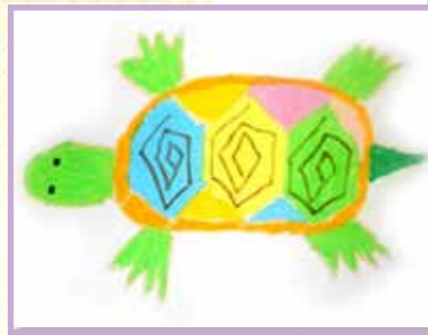
有趣的烏龜 2B 陳鈺淇