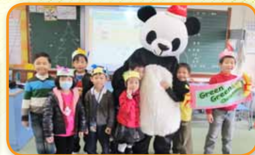
「愛國、愛地球」環保聖誕派對。

校本國民教育課程旨在透過「生活事件」讓學生認識國情及培養良好的素質。課程內容以國情教育及品德教育為核心，配以多元化的聯課及生活體驗課，建構學生正面的價值觀及生活態度。