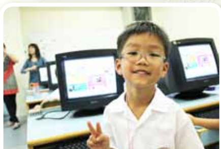
學習無限 Fun——英語電子學習課程