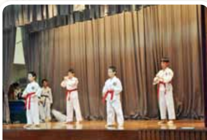
強身健體及提升意志力的跆拳道