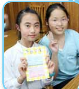
大家跟新朋友互相祝福。

本校參加了由香港中文大學資訊科技教育促進中心舉辦的「港臺配對學校網上遊戲專題研習 2011-2012」，透過使用網上遊戲討論平台——「學習村莊」，與多間本港及台北學校的學生作網上交流討論，讓學生主動自學，提升他們的高階思維能力。計劃更於三月底，安排了本校師生及家長代表到訪台北的配對學校——臺北市立教育大學附設實驗國民小學。學生除可參觀校園及參與課堂的學習外，還實地考察兩地文化差異，拓闊視野。