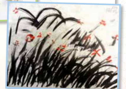
草原 1C 周子晴