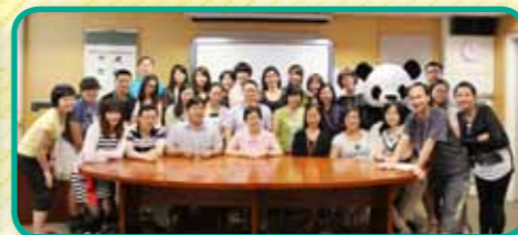
「廣源」「天天」，以人為本。