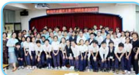
我們感謝教大附小的師生熱情款待！