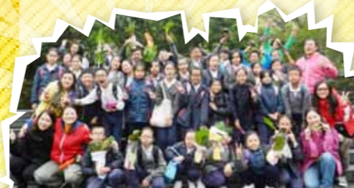
同學參加嘉道理農場暨植物園舉辦的「太陽不下山」音樂戲劇工作坊，透過音樂和戲劇形式，認識到地球暖化的成因及影響。