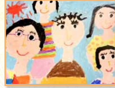
撕貼 1E 賀得善