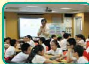
數學生活，思考無束 (小六數學)。