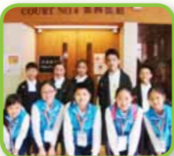
小先鋒於高等法院參與模擬審訊。