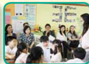
分層學習，各展所長 (小三英語)。