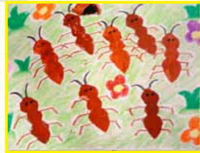
螞蟻找食物 2D 余熹彤