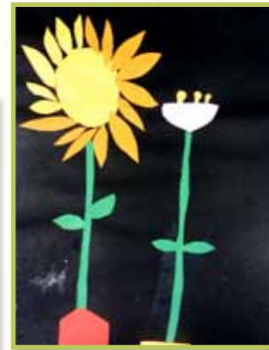
美麗的花兒 3A 李顯揚