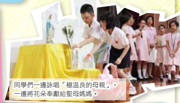
同學們一邊詠唱「極溫良的母親」，一邊將花朵奉獻給聖母媽媽。