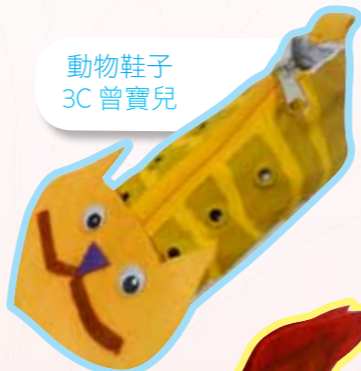
動物鞋子 3C 曾寶兒