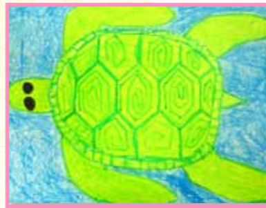
有趣的烏龜 2D 李佳蔚