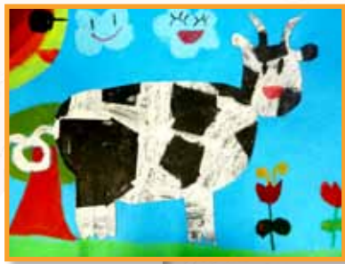
黑白動物會 3A 黃靖婷