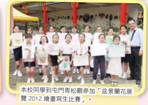
本校同學到屯門青松觀參加「盆景蘭花展覽 2012 繪畫寫生比賽」。