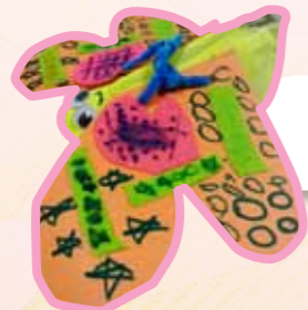
動物鞋子 3B 林普茵