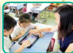
電子學習，創意無限 (小一英語)。