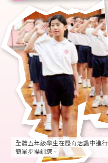
全體五年級學生在歷奇活動中進行簡單步操訓練。