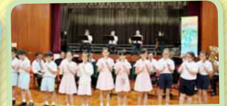
音樂事務處導師到校向小四同學介紹不同的樂器，並邀請同學隨樂團頌唱及用牧童笛合奏《樂韻播萬千》主題曲。