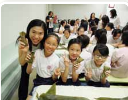
端午糉子齊齊來包