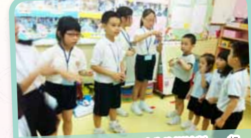
同學們透過 Smart teens 服務生培訓計劃，一起探訪幼稚園的小朋友，並帶領他們玩遊戲。