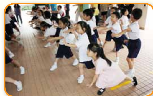
齊做健康小國民—小一太極課。