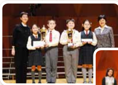
同學在優勝者音樂會中與頒獎嘉賓拍照留念。