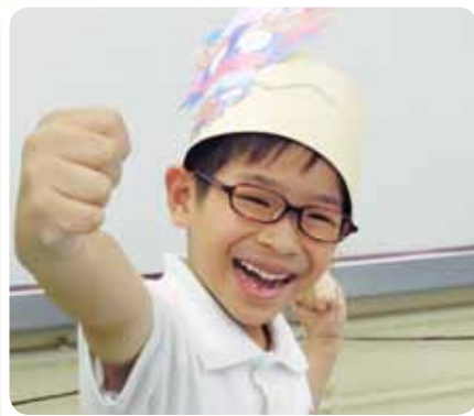
我們設計的「龍的傳人帽子」