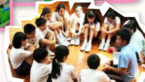
每完成一項任務，歷奇活動的小組導師均會與隊員進行反思及討論，分享意見，培養團隊精神。