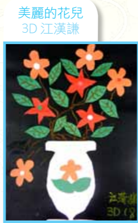
美麗的花兒 3D 江漢謙