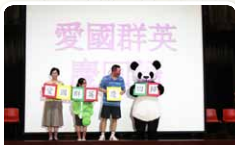
2011-12 年度德育雙周主題——「愛國群英慶回歸」

我們以中國教育家陶行之先生的教育理念作為學校的教育哲學。我們深信教育人和栽種樹木一樣，首先要認識樹木的特點，區別不同情況後再給以施肥和澆水，這叫“因材施教”。