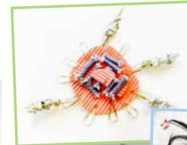
大風吹 1B 梁詠恩