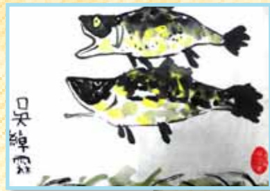
「魚」水墨畫 1C 吳綽霖