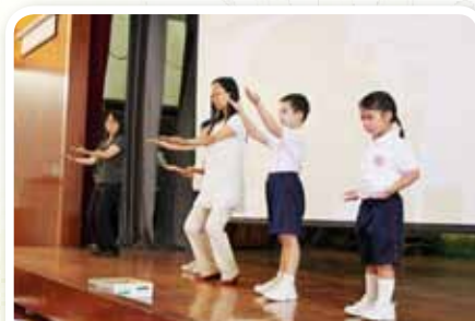
身心靈健康操——「定靜運動」